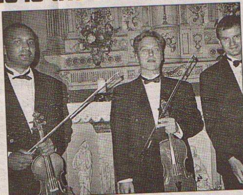
Les nombreux rappels dont ils ont fait l'objet sont une preuve de talent de ces trois musiciens.

Professionnels depuis plus de dix ans, ces trois musiciens sont également professeurs de conservatoire en région parisienne. Ils se produisent régulièrement en solo dans diverses formations et notamment au sein de l'orchestre du département de l'Oise.